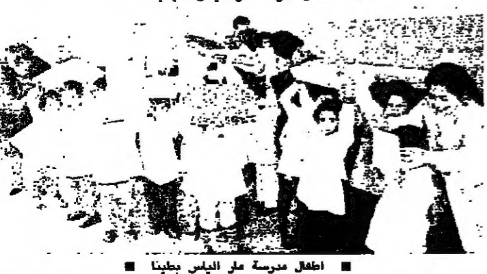
اطفال حضنة سن الليل يحملون الهدايا